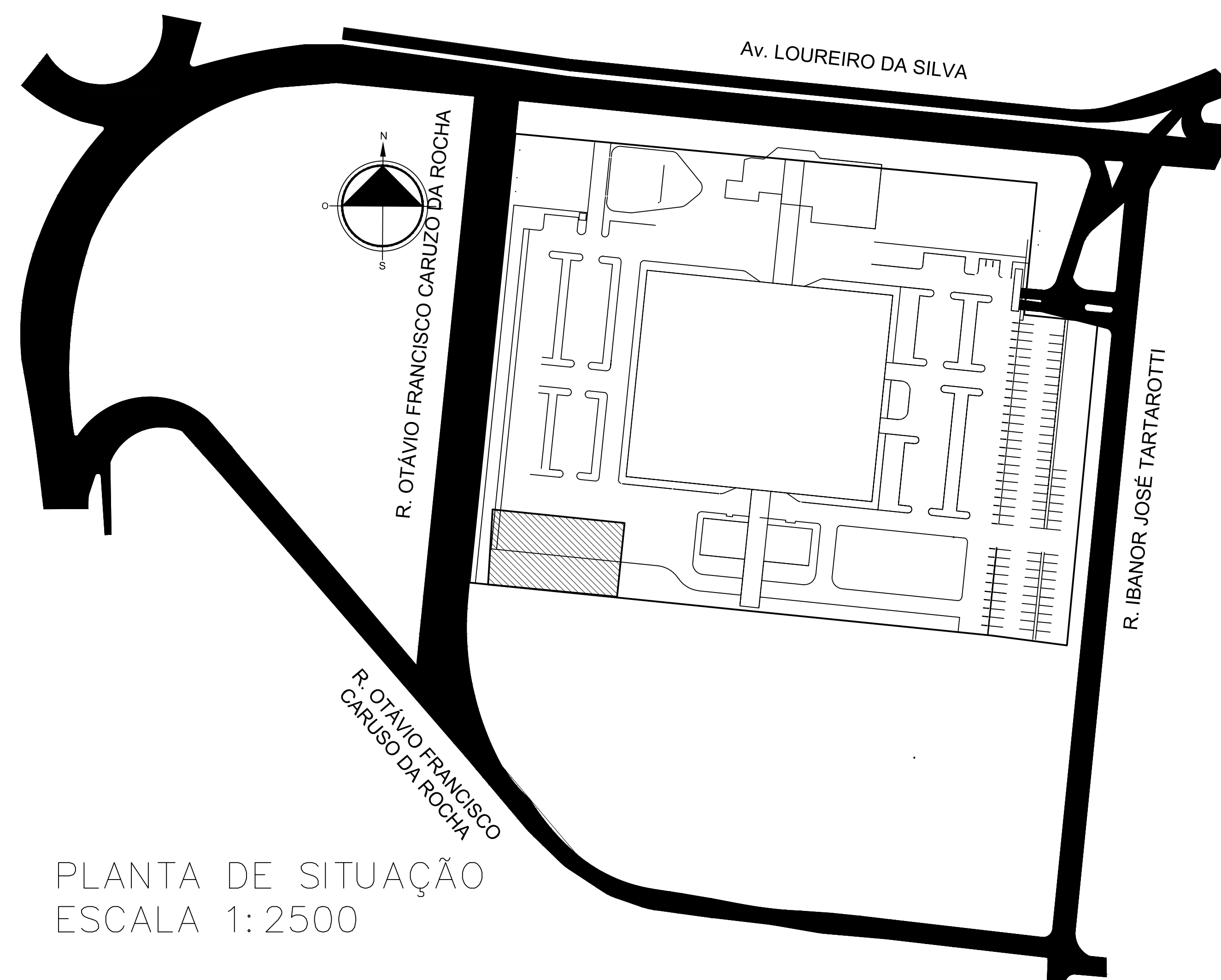
PLANTA DE SITUAÇÃO ESCALA 1:2500