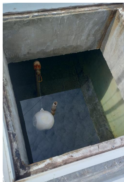
Figura 11 - Reservatório Oeste: Boia