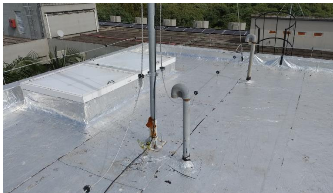
Figura 7 - Reservatório Oeste: Vista Superior