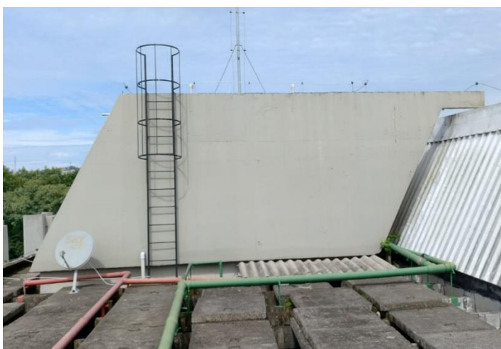
Figura 2 - Reservatório Leste: Vista Lateral