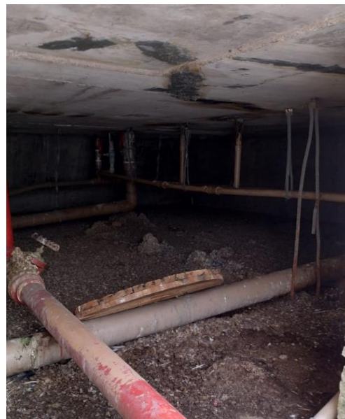
Figura 5 - Reservatório Leste: Casa de Barriletes