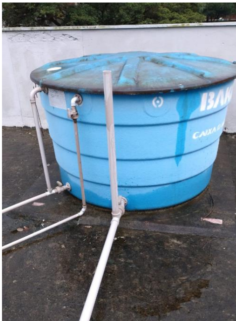
Figura 1- Reservatório Centro de Convivências

CENTRO DE CONVIVÊNCIAS: RESERVATÓRIO DE 2.000 LITROS.