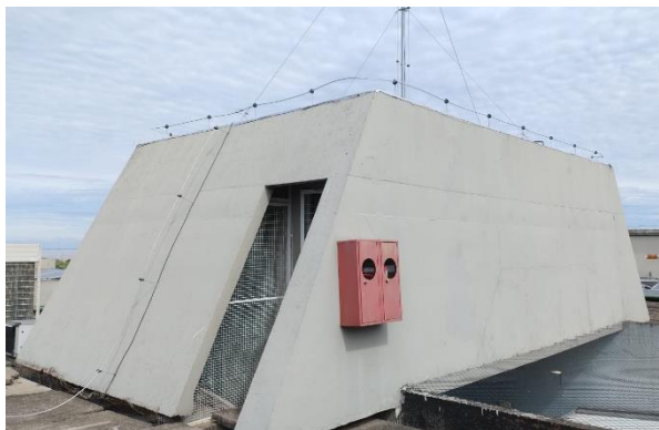
Figura 8- Reservatório Oeste: Vista Lateral