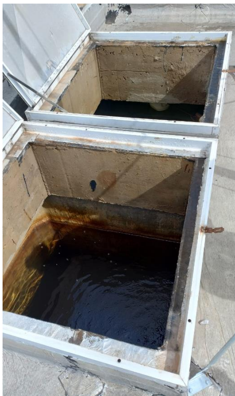
Figura 4 - Reservatório Leste: Células