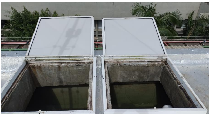
Figura 10 - Reservatório Oeste: Tampas das células