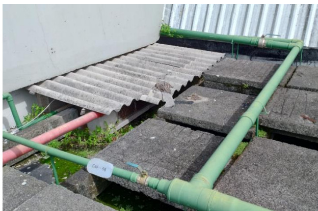
Figura 12 - Sistema de Barriletes