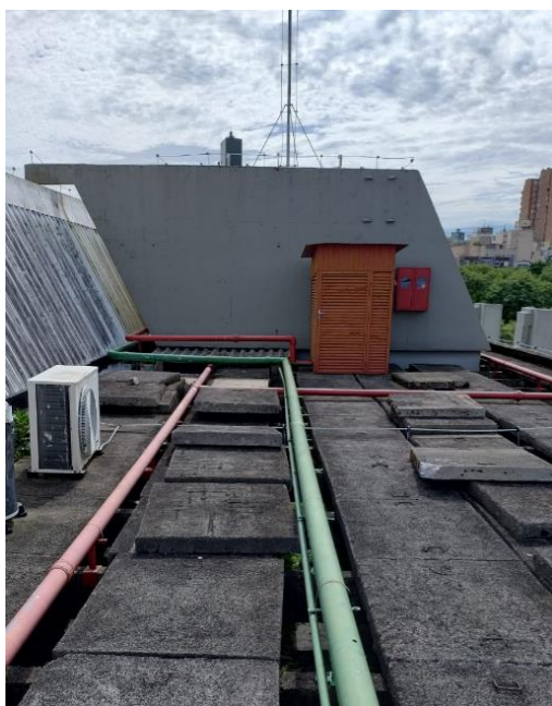
Figura 3 - Reservatório Leste: Vista Lateral

PALÁCIO ALOÍSIO FILHO: RESERVATÓRIO LESTE.