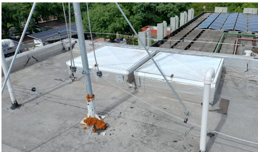
Figura 6 - Reservatório Leste: Vista Superior