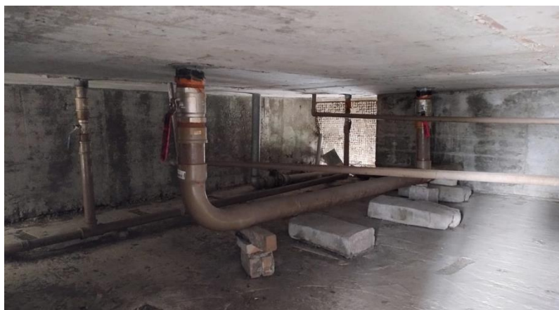
Figura 9 - Reservatório Oeste: Casa de Barriletes