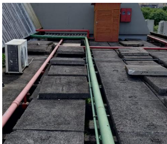
Figura 15 - Sistema de Barriletes