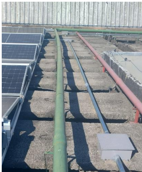
Figura 13 - Sistema de Barriletes